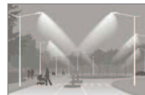
STŘEDNĚ VELKÉ PLOCHY